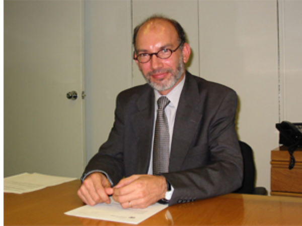
Ambassadeur de Alba du Mexique